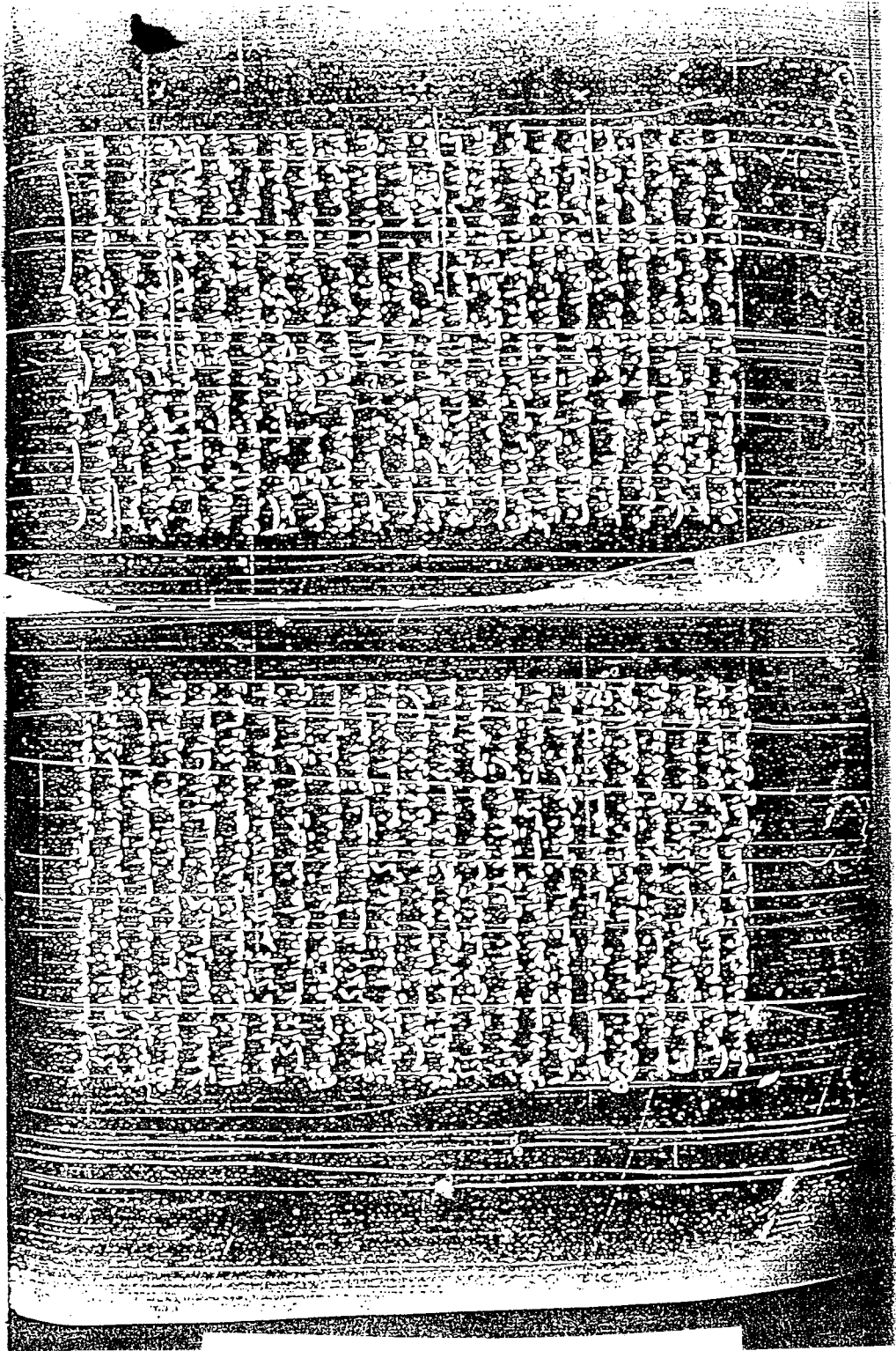
الصفحة الأولى من النسخة (د)